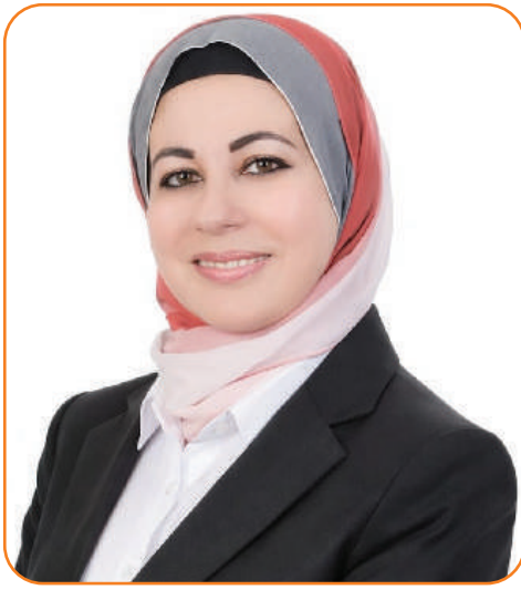
بقلم: أ. سهير أومري رئيسة تحرير مجلة العنقاء

المنهوبة، وتُفصل المؤسسات العامة عن شبكات العنف والفساد، فإن "كلفة الخوف" تنخفض. عندها يعود المغترب ليفتح مشروعًا، ويعود التاجر ليوسع عمله، ويعود صاحب الأرض ليستثمرها، وتبدأ دورة اقتصادية حقيقية.