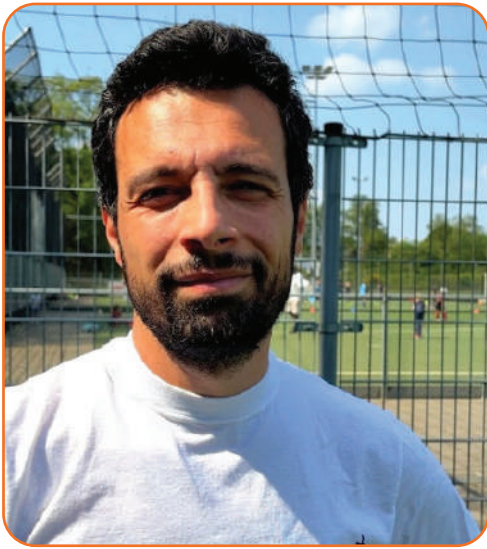
بقلم: أ. توفيق زين العابدين باحث ومتخصص في علوم التدريب الرياضي حاصل على ماجستير في التربية البدنية