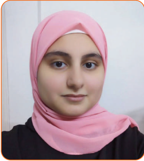
بقلم: أ. سما الزيات طالبة هندسة