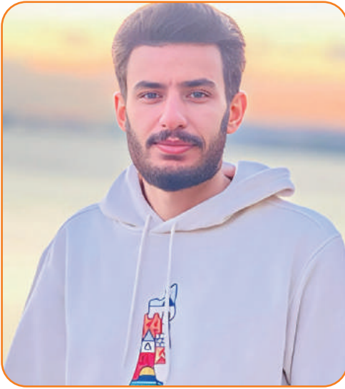
بقلم: أ. محمد زكريا البدوي عضو تيار سورية الجديدة