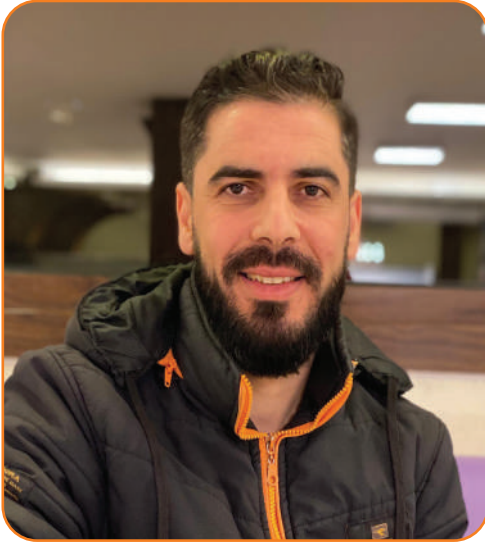
بقلم: أ. باسل عبد الله الرفاعي كاتب ومدقق لغوي